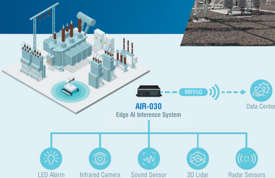
Рис. 1. Система інспекції просто неба з використанням робота і периферійного ШІ-комп'ютера AIR-030

дарних датчиків, дозволяючи інтелектуальним інспекційним роботам виявляти перешкоди при самостійному переміщенні або дистанційному керуванні в певних зонах заводу. Через порти USB AIR-030 підтримує інфрачервоні камери і датчики для виявлення аномалій температури і рівня шуму на об'єктах енергетики навколо електричних підстанцій. AIR-030 також підтримує введення зображень з камер високої роздільної здатності через порт Ethernet для збору зображень з електролічильників і перетворення їх в цифрові дані. Потім він передає дані аналізу по бездротовому зв'язку в бекенд-центр управління або хмарний сервер, що дозволяє своєчасно оцінювати експлуатаційні ризики і завчасно попереджати про несправності в електрообладнанні.