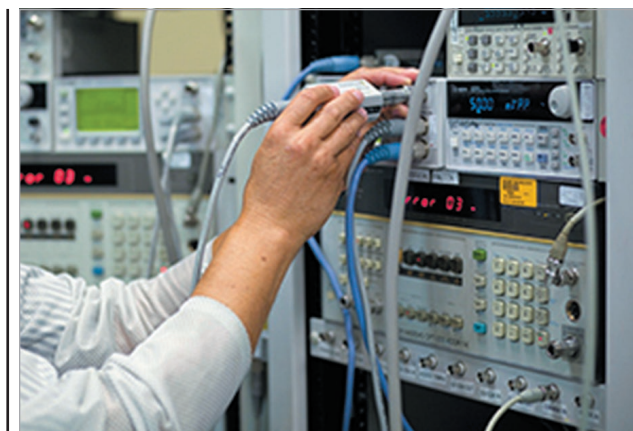
Рис. 1. Встановлення цифрового мультиметра у виробничу випробувальну систему