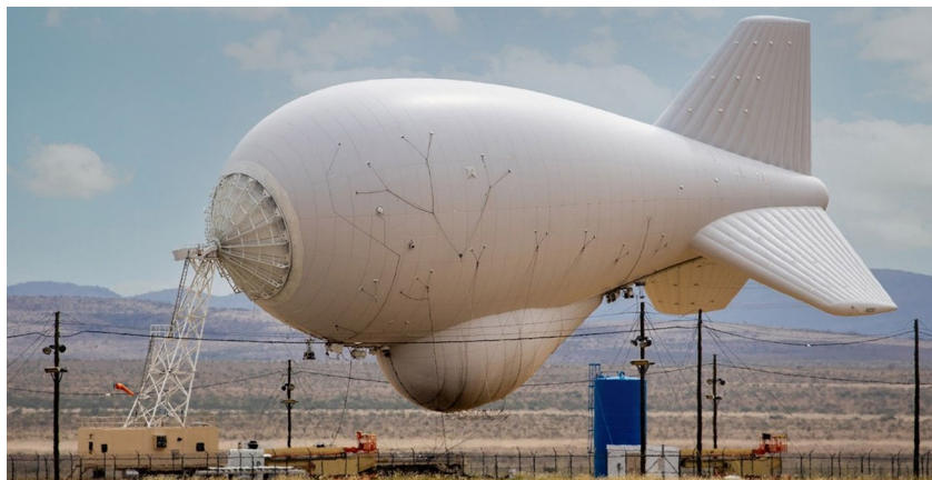
Рис. 1. Платформа спостереження аеростата

які допомагають спрямовувати дрони та інші безпілотні літальні апарати в зонах, де немає GPS. Теплопровідні клеї, такі як клей 8349TFM , допомагають запобігти перегріванню, забезпечуючи безперебійну роботу цих життєво важливих систем.