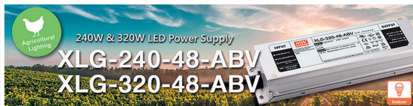
Рис. 1. Драйвери світлодіодів для сільськогосподарського освітлення 240 і 320 В

За додатковою інформацією, а також з питань придбання продукції MEAN WELL звертайтеся до офіційного дистриб'ютора MEAN WELL Enterprises Co., Ltd на території України – Компанії CEA: тел.: (044) 330-00-88, e-mail: info@sea.com.ua